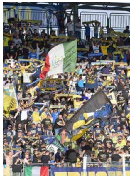
La Curva Nord

Perchè il calcio è fatto non solo di vittorie ma anche di sconfitte anche per le formazioni campioni del mondo. Comunque, tornando ai sogni dei tifosi, diciamo guai a non averne. Sogni e speranze, binomio importante per tutti e necessario per sconfiggere la rassegnazione che è sempre negativa. E che, grazie al Frosinone di Fabio Grosso, i tifosi del Leone stanno dimostrando di non possedere. E poi sognare non costa niente.