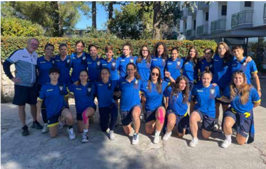
Il Frosinone Calcio femminile partecipante al campionato di Serie C