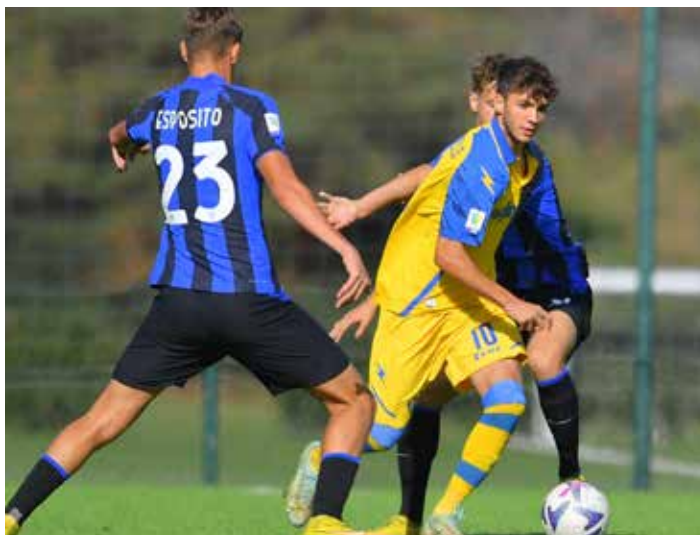
Una fase di gioco di Inter-Frosinone

Torino-Milan 2 - 0; Cagliari - Sassuolo 4 a 2; Roma - Lecce 1 - 0; Empoli - Sampdoria 0 - 0; Inter - Frosinone 2 a 2; Napoli - Udinese 1 - 0; Cesena - Juventus 1 - 2; Bologna - Fiorentina 0 - 3; Atalanta - H. Verona 1-2. Il prossimo turno: Sampdoria - Bologna; Lecce - Torino; Sassuolo - Empoli; Frosinone - Roma; Fiorentina - Cesena; Milan - Atalanta; Udinese - Cagliari; Hellas Verona - Napoli; Juventus - Inter.