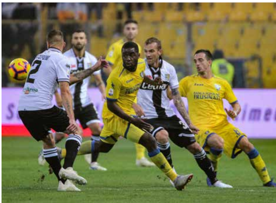
Un contrasto di gioco nell'ultima sfida in A con il Parma al Tardini