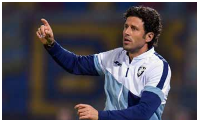
Mister Fabio Grosso