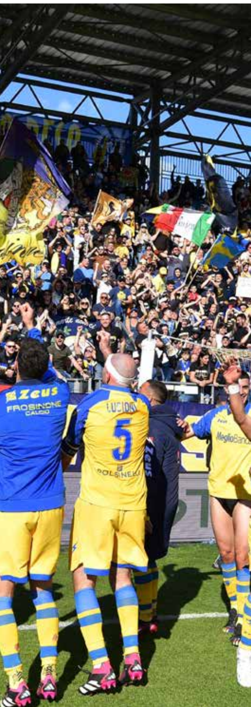
Dopo la vittoria contro l'Ascoli