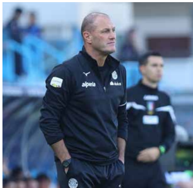
Pierpaolo Bisoli, allenatore del Sudtirolo

Dopo l'inizio di campionato con il freno a mano tirato nelle prime tre partite concluse con altrettante sconfitte, l'arrivo in panchina di Pierpaolo Bisoli il 29 agosto dell'anno scorso si è rivelato il toccasana per i mali che la formazione aveva mostrato, derivanti con tutta probabilità dall'impatto con un campionato molto difficile per tutti. La vittoria sul Pisa ha invertito la negativa tendenza con l'inizio di una serie di risultati positivi che è durata fino all'incontro con il Frosinone che, giocato allo stadio "Druso" alla quindicesima giornata e concluso in parità, ha interrotto la prima striscia di dodici partite utili consecutive formata da cinque vittorie e da sette pareggi, l'ultimo dei quali ottenuto con il Frosinone. Dopo due sconfitte, una vittoria e un pareggio, la squadra biancorossa ha iniziato una seconda striscia di risultati positivi ini-