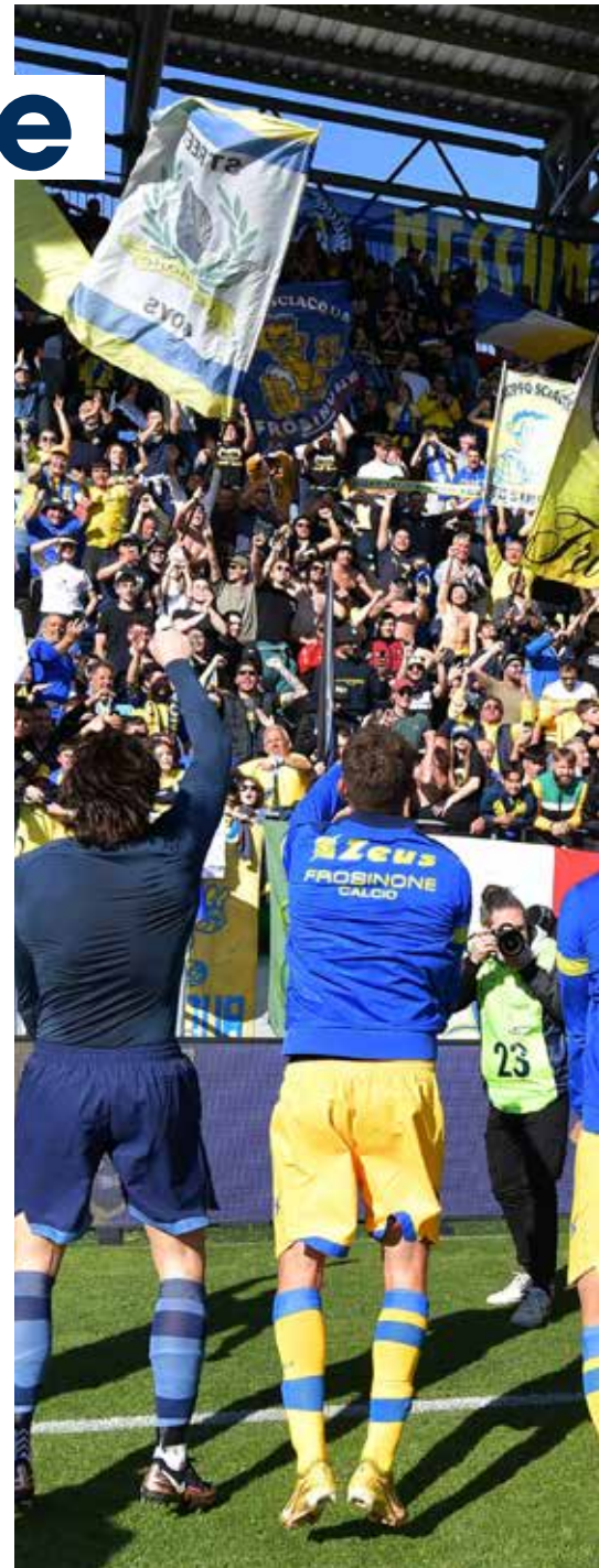
La squadra sotto la curva do

Proprio sul campo della "Unipol Domus cagliaritana" la conferma che la formazione di Fabio Grosso, ancorché con qualche rallentamento nella corsa al vertice della classifica durante il lungo e difficile percorso ormai in dirittura di arrivo, è stata viva e lucida nonostante la partita sia andata di molto oltre i novanta minuti regolamentari. Sul piano non solo della tenuta ma anche della brillantezza della manovra assicurata dai cambi che Grosso ha effettuato.