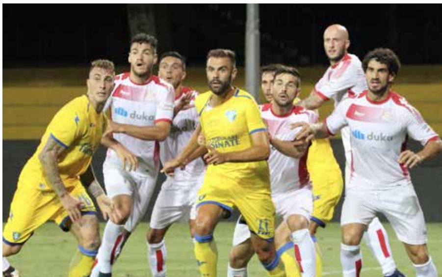
Una foto della gara di Coppa Italia giocata nel 2018 a Benevento